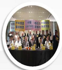
新冠狀病毒記者會