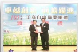
獲選全國最優團體